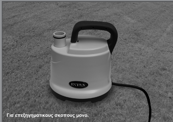
Για επεξηγηματικού σκοπούς μόνο.

Μην παραλείψετε να δοκιμάσετε και τα ακολουθα εξαιρετικά προϊόντα της Intex: Πισινες, Εξαρτήματα Πισίνας, Φουσκωτες Πισινες και Παιχνίδια Σπιτιού, Στρωματα Αερα και Βαρκες, τα οποία διατίθενται μέσω των εμπορικών αντιπροσώπων μας ή του δικτυακού τοπou μας.